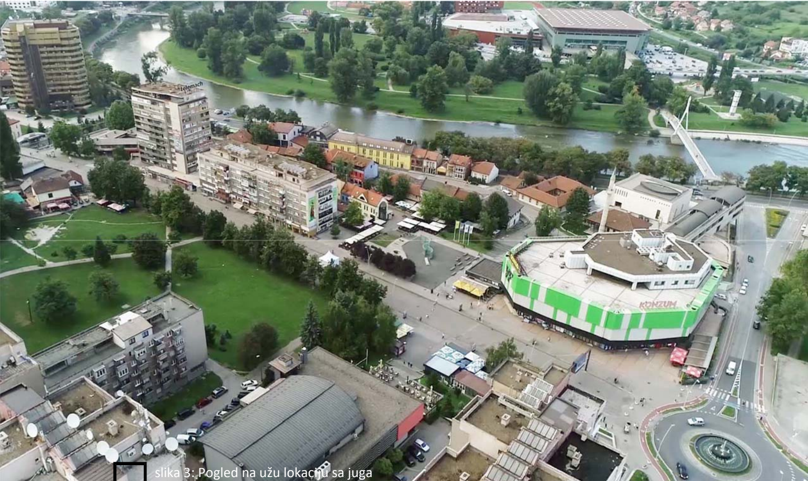
slika 3: Pogled na užu lokaciju sa juga