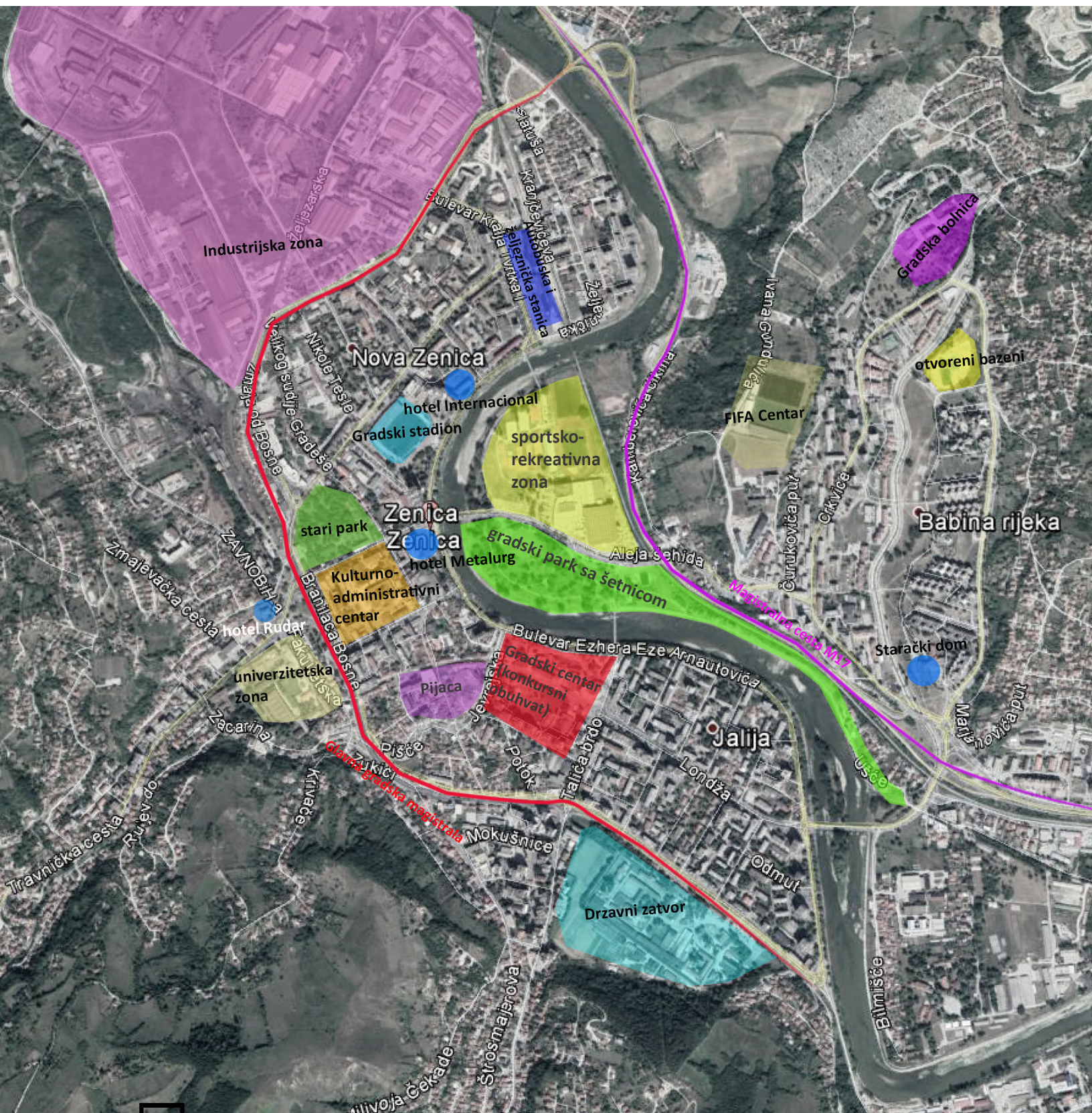
Slika 5: Gradske zone, saobraćajnice i javni objekti