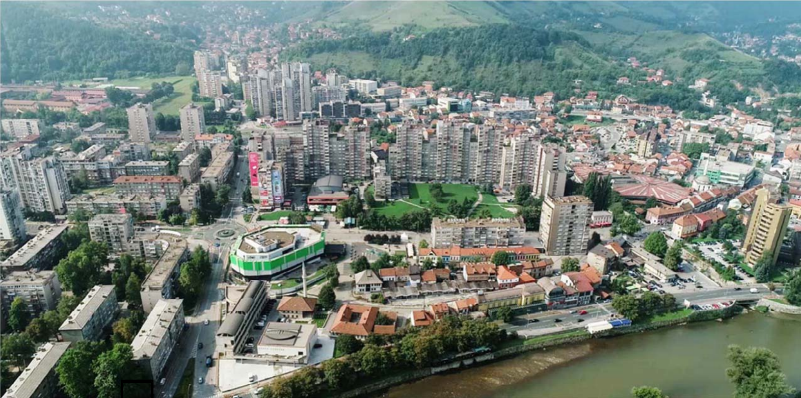
Slika 1: pogled prema lokaciji sa sjeverne strane