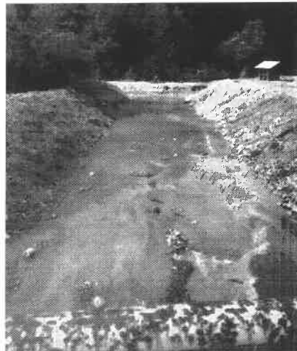
Babina rijeka – čišćenje nizvodno od mosta kod škole (prije i poslije intervencije)