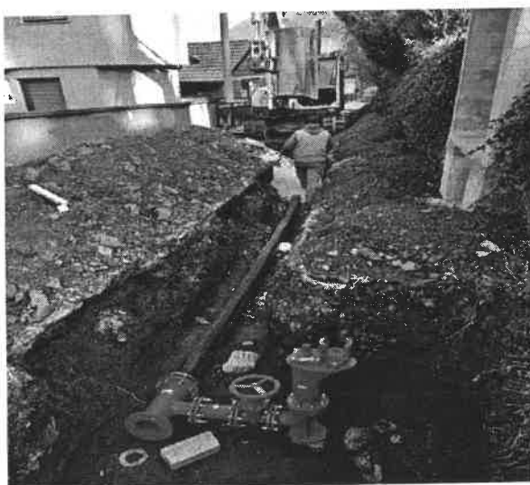
Slika broj 1: Rekonstrukcija vodovoda u naselju Stara Nemila

Krajnji rezultat realizacije projekta je završen i objedinjen vodovod za kompletno naselje Stara Nemila - MZ "Nemila".