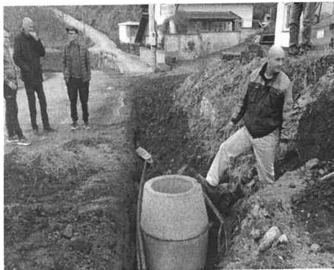
Slika broj 2: Izgradnja kanalizacije u naselju Izgrtine