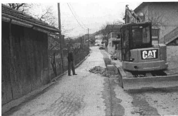
Slika broj 8: Izgradnja dijela fekalne kanalizacije u naselju Stranjani