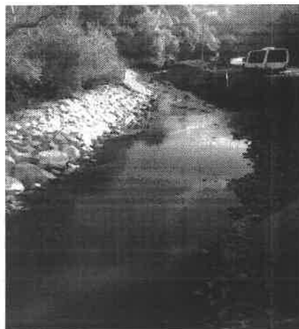
Babina rijeka – obala rijeke uzvodno od mosta kod škole (prije i poslije intervencije)