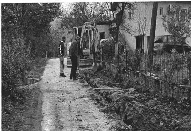
Slika broj 12: Rekonstrukcija razvodne mreže vodovoda Prika