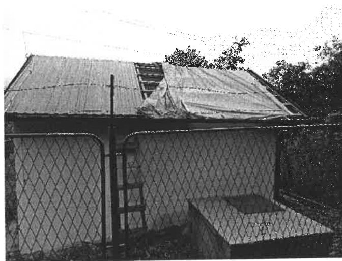
Slika broj 3: Pumpna stanica vodovoda Džomba

Ugovorom o izvođenju radova obuhvaćeni su radovi na sanaciji i otklanjanju nedostataka na pumpnoj stanici vodovoda Džomba, a sve u cilju rješavanja problema snabdijevanja pitkom vodom mještana u naselju Gradišće.