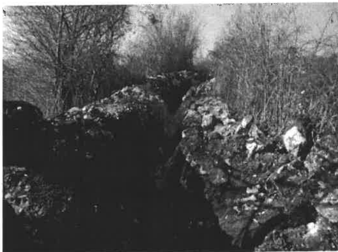
Slika broj 4: Izgradnja kanalizacije u naselju Hrustići