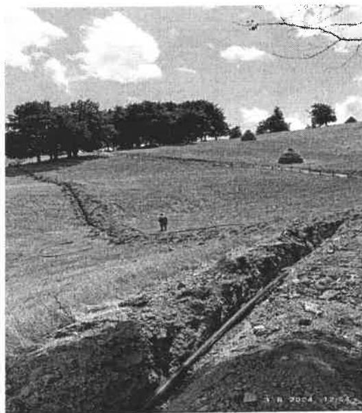
Slika broj 6: Ugradnja materijala (Orahovica – Vesela bukva)