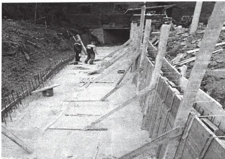
Slika broj 14: Nastavak regulacije potoka Baretnjak

Na osnovu Ugovora o izvođenju radova utrošena su sredstva u iznosu od 91.702,40 KM. Izvedeni su radovi na izgradnji nastavka regulacije potoka Baretnjak, od profila 24 do profila 26+10m, odnosno izgradnji otvorenog kanala ukupne dužine 60 m, sandučastog poprečnog profila.