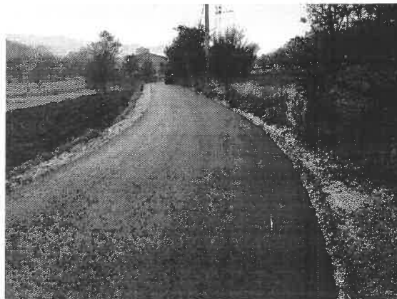
Sanacija i asfaltiranje dionice ceste