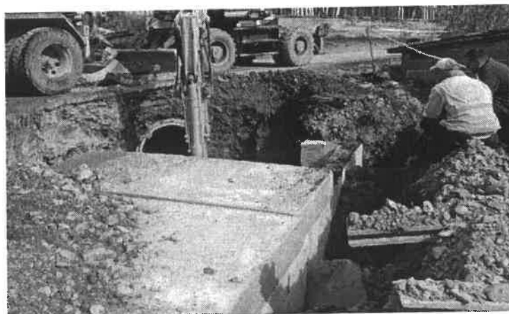
Slika broj 11: Regulacija Ciganskog potoka u naselju Stranjani

Izvedeni su radovi na regulaciji Ciganskog potoka u dužini od 20 metara, uzvodno od ranije završene faze regulacije, čime je smanjena mogućnost plavljenja lokalne saobraćajnice kao i postojećih privrednih i stambenih objekata.