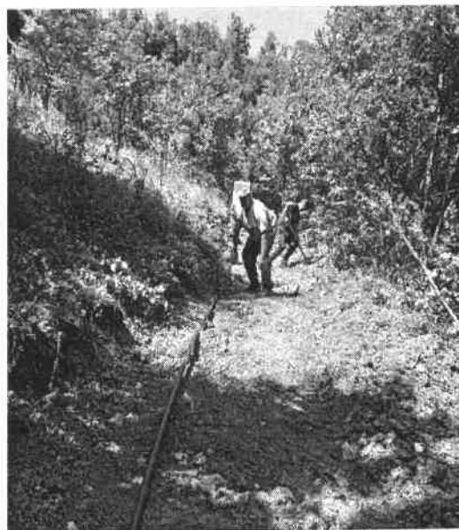
Slika broj 7: Ugradnja materijala (Perin Han – Palinovići)