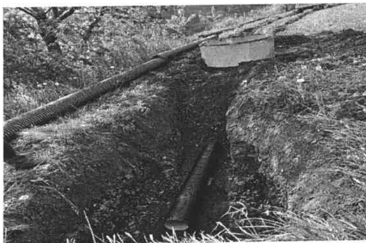
Slika broj 10: Izgradnja kanalizacije u naselju Vukotići