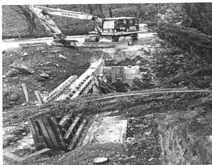
Slika broj 5: Izgradnja pregrade na Orahovičkoj rijeci

Realizacija Ugovora na izvođenju radova na izgradnji pregrade na Orahovičkoj rijeci, u MZ “Orahovica” obuhvatila je izgradnju AB konstrukcije koja za cilj ima usporavanje vodotoka i smanjenje rizika od poplava i nanosa nizvodno od pregrade.