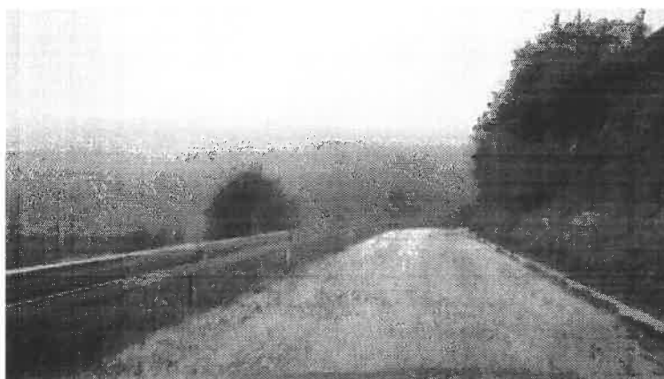
Postavljena elastično odbojne ograde na lokaciji Trešnjeva Glava