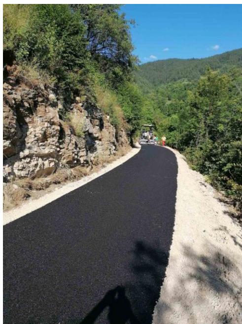
Sanacija puta za Gradinu

Radovi na sanaciji puta za Gradinu započeti su 02.08.2022. godine, a završeni 12.08.2022. godine. Ugovorenim predmjerom i predračunom, predviđena je sanacija i asfaltiranje starog puta za selo Gradinu u dužini od 841,0 m. Radovi su obuhvatali mašinski iskop, uređenje planuma puta, nasipanje i ugradnja tamponskog materijala i asfaltiranje asfaltnom masom BNS 22 u sloju debljine 7 cm, te završno nasipanje i uređenje bankine.