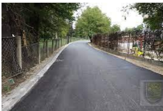
Sanacija ulice Zacarina

Radovi na sanaciji dijela ulice Zacarina započeti su 15.08.2022. godine a završeni 15.09.2022. godine. Izvršena je sanacija dionice od spoja sa ulicom Travnika do "Sušića" mlina, gdje je na prvom dijelu izvršena sanacija dotrajalog asfaltnog zastora, te izvršena izgradnja parking prostora uz ogradu Instituta "Kemal Kapetanović", dok je u drugom dijelu ulice izvršeno asfaltiranje makadamskog i asfaltnog dijela ulice u postojećim gabaritima sa rješavanjem odvodnje.