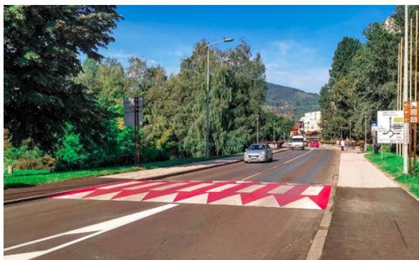
Sanacija ulice Aleja šehida

Radovi na sanaciji ulice Aleja Šehida započeti su 15.08.2022. godine a završeni 01.09.2022. godine. Ugovorenim radovima predviđena je sanacija degradiranog asfaltnog zastora saobraćajnice i pješačkih staza u dužini od 400,0 m. Izvršena je sanacija dionice ulice od Kamberovića mosta do Gradske arene "Husejin Smajlović", čime su poboljšani elementi saobraćajnice i odvodnje oborinskih voda. Na predmetnoj dionici urađene su dvije platforme u cilju bezbjednosti pješaka, a time pozitivno riješen zahtjev Udruženja paraplegičara i oboljelih od dječije paralize.