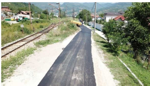
Sanacija ulice Visočka

Radovi na sanaciji ulice Visočka započeti su 29.07.2022. godine a završeni 17.08.2022. godine. Ugovorenim predmjerom i predračunom, predviđena je sanacija i asfaltiranje dionice ulice u dužini od 410,0 m, a koji se sastojao od dva dijela, prvi dio je bila sanacija dotrajale betonske podloge i drugi dio sanacija makadamske podloge. Na dijelu sa makadamskom podlogom izvršena je zamjena trupa kolovozne konstrukcije, te završno asfaltiranje (makadamska i betonska podloga) sa uređenjem bankina.