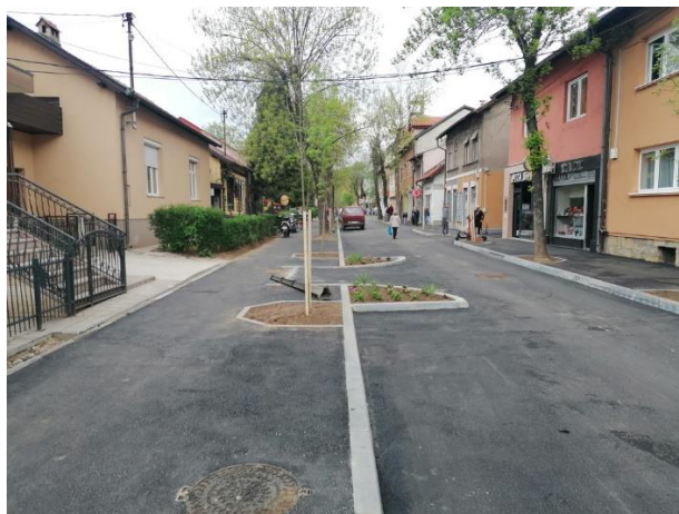
Rekonstrukcija ulice Masarykova (P 1a do P 10a)

Izvođač radova je uveden u posao dana 20.01.2022.godine, a radovi završeni dana 11.08.2022.godine Rekonstrukcija dijela ulice Masarykovaje izvršena je u dužini od 225,0 m. Radovi su obuhvatili rješavanje odvodnje, asfaltiranje i rješavanje stacionarnog saobraćaja izgradnjom parking prostora. U sklopu rekonstrukcije predmetne dionice, izvršena je izmjena instalacija privrednih društava “ BH Telecom”, JP” Elektroprivreda”, JP “Grijanje” i JP “Vodovod i kanalizacija”. Pored navedenog, izvršeno je razdvajanje oborinske i fekalne kanalizacije, te izvršena odvodnja oborinske kanalizacije u recipijent, odnosno rijeku Bosnu.