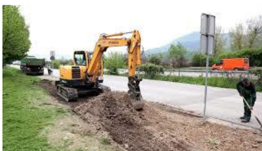
Izgradnja pješačke staze duž ulice Bistua Nuova

Sredstva za realizaciju Projekta, u iznosu od 100.000,00 KM, obezbijedena su Odlukom Vlade Federacije BiH broj: V. broj 1404/2021 od 16.09.2021. godine.