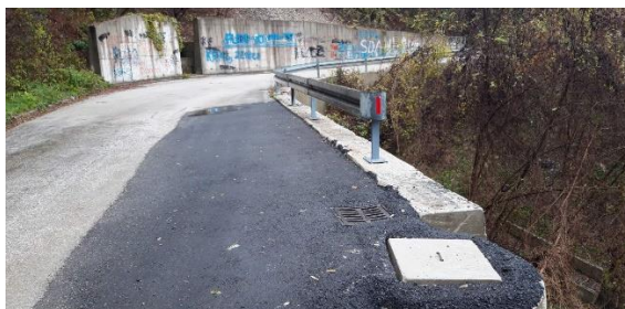
Sanacija oštećenja na putu Topčić polje-Lazine izgradnjom potpornog zida