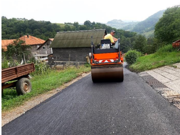
Sanacija i asfaltiranje starog puta za Obrenovce