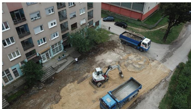
Sanacija platoa i prilaza zgradi u ulici Zije Dizdarevića broj 30.

Radovi na sanaciji platoa i prilaza zgradi u ulici Zije Dizdarevića broj 30. u naselju Blatuša započeti su 25.07.2022. godine a završeni 18.08.2022. godine. Ugovorenim radovima urađena je sanacija i asfaltiranje makadamskog platoa ispred zgrade u ulici Zije Dizdarevića. Prije završnog asfaltiranja riješena je odvodnja kako sa platoa tako i sa saobraćajnice i postavljeni ivičnjaci u dužini od 80,0 m.