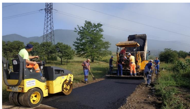
Sanacija puta Gradišće - Strnokosi

Radovi na sanaciji puta Gradišće - Strnokosi započeti su 10.08.2022. godine a završeni 02.09.2022. godine. Ugovorenim predmjerom i predračunom, predviđena je sanacija i asfaltiranje puta Gradišće – Strnokosi u dužini od 1.200,0 m, gdje je izvršen mašinski iskop, nasipanje i valjanje tamponskog materijala, rješenje odvodnje na kritičnim dionicama, te završno asfaltiranje i uređenje bankina. Predmetnim putem je izvršeno spajanje Kočevskog sliva sa MZ Gradišće, gdje bi u slučaju obustave saobraćaja na regionalnoj cesti od Stranjana do Zenice mogao služiti i kao alternativni put.