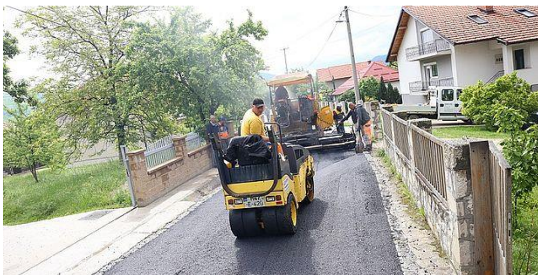
Sanacija Đerzelezove ulice

Uvođenje izvođača radova u posao izvršeno 09.08.2021.godine, radovi vršeni do 06.09.2021.godine. U navedenom periodu izvršeno mašinsko skidanje postojećeg asfalta, iskop, nasipanje tamponskog materijala sa valjanjem. Dana 06.09.2021.godine radovi su obustavljeni zbog postavljanja instalacija plinovoda koje je bilo u obavezi JP “Zenica Gas” d.o.o. Zenica. Po završetku instalacija plinovoda, nastavljeni su radovi dana 09.05.2022.godine. Nastavak radova je obuhvatio izradu dijela kišne kanalizacije, popravku postojećih ivičnjaka, korekciju visine postojećih poklopaca, te završno asfaltiranje. Radovi su završeni dana 23.05.2022.godine. Sanacijom predmetne ulice Đerzelezova u dužini od 1.530,0 m, obezbjeđena je bolja povezanost MZ Perin Han i MZ Klopče.