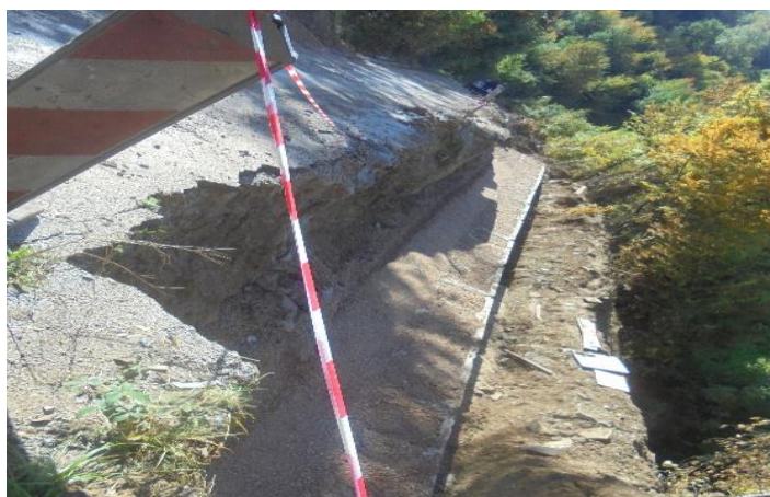
Izgradnja potpornog zida na putu za selo Plahoviće

Zbog prekoračenja rokova primijenjena je ugovorna kazna, odnosno obračunati su penali u iznosu od 722,94 KM.