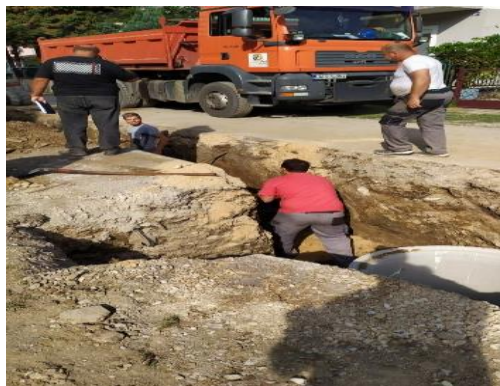
Radovi na novoj trasi oborinske kanalizacije u ulici Lukovo Polje

U toku realizacije Ugovora došlo je do prekida radova i konzerviranja gradilišta zbog zimskih uvjeta. Do momenta prekida izvođenja radova uspješno je završeno razdvajanje oborinske i fekalne kanalizacije. I pored izuzetno zahtjevnog projekta i dubina iskopa do 2 m uz ostale postojeće komunalne instalacije, kao i postavljanja dodatnih revizionih okna kako bi nakon asfaltiranja mogli kupiti svu oborinsku vodu, završeni su svi radovi izuzev asfaltiranja i postavljanja odgovarajućih poklopaca i rešetki na novoizgrađenim revizijama i slivnim kacama i uređenju zemljišta oko ispusne građevine. Radovi su u cijelosti okončani dana 06.06.2022.godine.