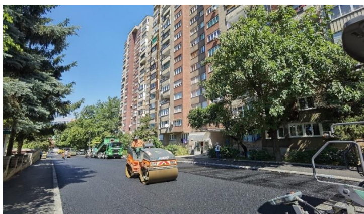
Sanacija ulice Mejdandžik

Radovi na sanaciji su započeti dana 14.07.2022. godine, a završeni dana 17.08.2022. godine. U sklopu radova izvršena je zamjena instalacije vodovodne linije od strane JP “Vodovod i kanalizacija” d.o.o. Zenica. Sanacijom ulice u dužini od 305,0 m poboljšani su elementi saobraćajnice, te izvršena korekcija pješačke staze uz Osnovnu školu “Meša Selimović”, tako da je omogućeno normalno kretanje pješaka, a pri tom zadržan parking prostor i jednak broj parking mjesta.