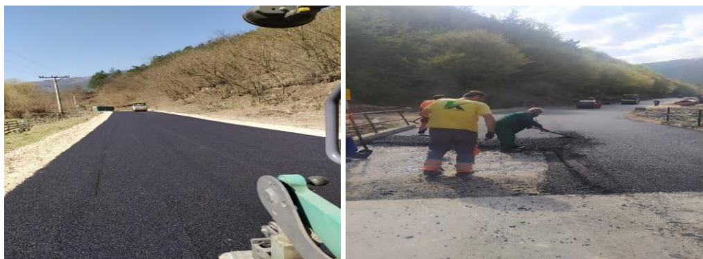
Sanacija lokalnog puta i mosta broj 1.za naselje Orahovica

Radovi na proširenju mosta broj 1. su završeni u skladu sa projektnom dokumentacijom dana 08.07.2022.godine.