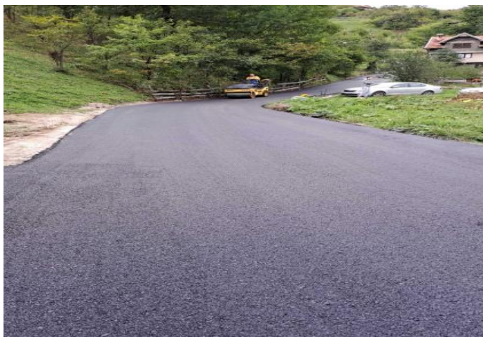
Sanacija puta u naselju Jezer – MZ Seoci

Radovi na sanaciji puta u naselju Jezer – MZ Seoci započeti su 23.09.2022. godine, a završeni 24.09.2022. godine. Ugovorenim predmjerom i predračunom, predviđena je sanacija i asfaltiranje degradirane betonske podloge u dužini od 360,0 m, a koji se sastojao od pripreme, čišćenja, izravnjanje degradirane dionice, nivelisanje poklopaca i završno asfaltiranje.