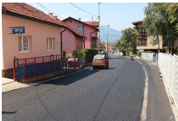
Sanacija ulice Štrosmajerova

Radovi na sanaciji ulica Štrosmajerova, Armije BiH i Gornjoženičke započeti su 14.07.2022. godine. Radovi su završeni 19.09.2022. godine. U toku izvođenja radova bile su intervencije na instalacijama u vlasništvu JP “Vodovod i kanalizacija” d.o.o. Zenica u ulici Štrosmajerova. Također, dinamiku izvođenja radova pratio je period sa veoma visokim dnevnim temperaturama te uz odvijanje saobraćaja koji se nije mogao u potpunosti obustaviti. U ulici Armije BiH izvršena je izmjena režima saobraćaja te ista postala jednosmjerna sa omogućenim parkiranjem pod uglom od 45° uz desnu ivicu kolovoza. Sanacija ulica je izvršena u dužini 1.200,00 m.