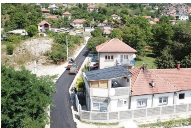
Sanacija i asfaltiranje spoja ulica Prvomajska i Bistua Nuova

Radovi na sanaciji i asfaltiranju spoja ulica Prvomajska i Bistua Nuova započeti su 29.07.2022. godine a završeni 11.08.2022. godine. Ugovorenim predmjerom i predračunom radova predviđeno je rušenje postojeće dotrajale asfaltne podloge, mašinski iskop, nasipanje tamponskim materijalom, te završno asfaltiranje asfaltnom masom BNHS 16 u sloju debljine 7 cm i završno uređenje bankine.