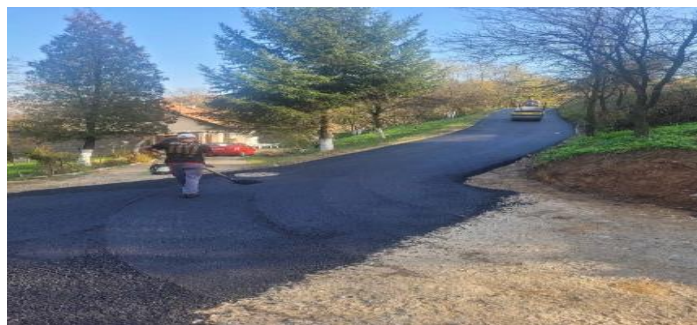
Sanacija dijela ulice Zvečajska