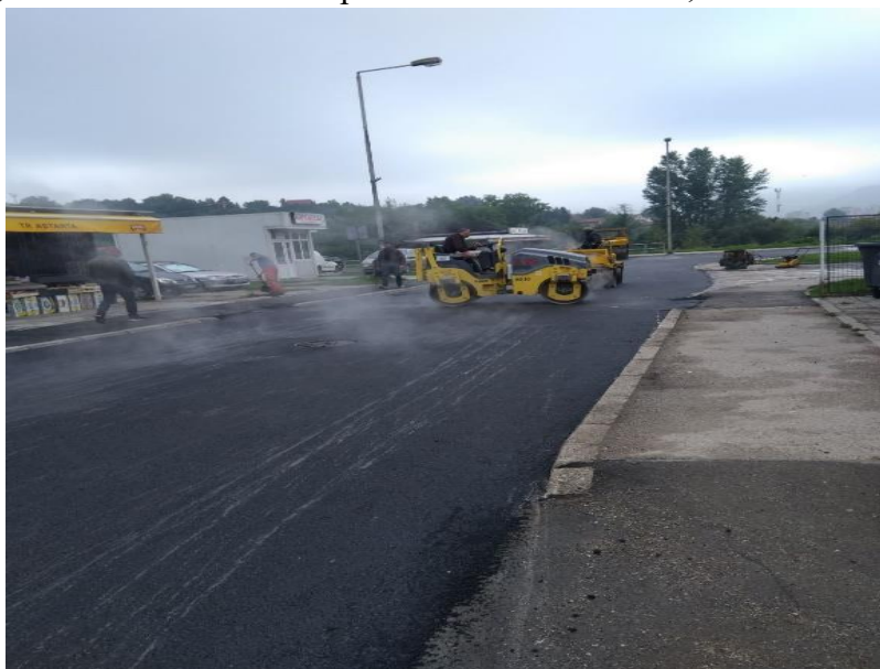
Sanacija ulice Željeznička

Zbog prekoračenja rokova primijenjena je ugovorna kazna (aktivirana je garancija za uredno izvršenje ugovora), odnosno obračunati su penali u iznosu od 5.329,96 KM.