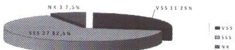
Grafikon 1: Kvalifikaciona struktura planiranog angažmana radnika u 2023. godini