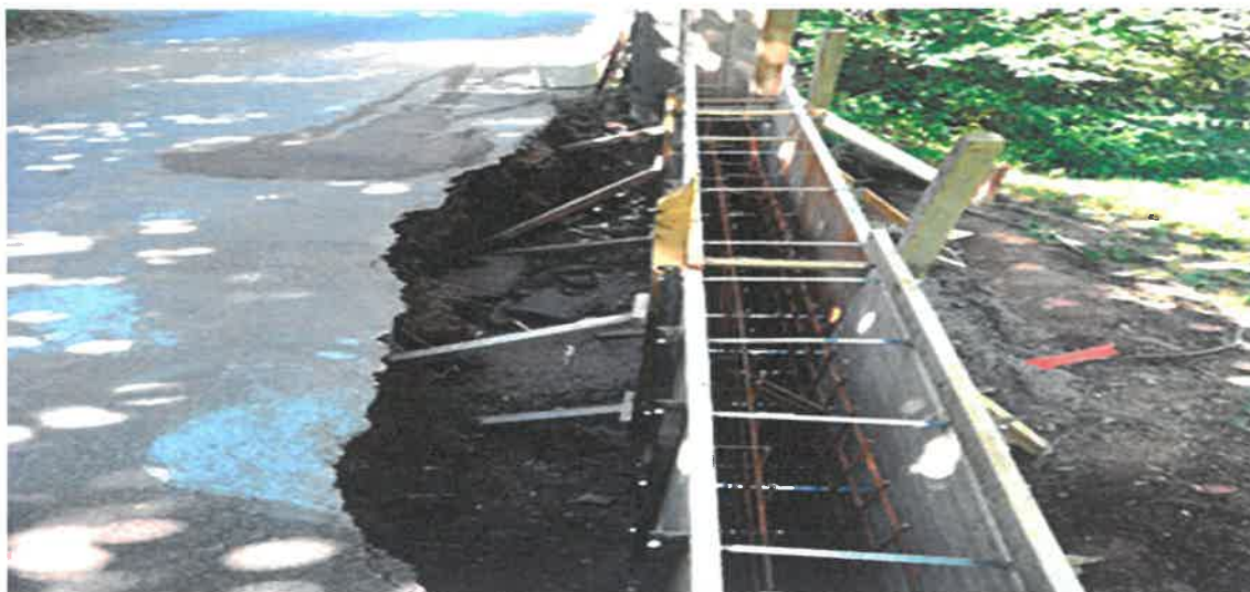
Izgradnja potpornog zida uz trup saobraćajnice u ulici Zvečajska, MZ Raspotočje

U Mjesnoj zajednici Raspotočje okončani su radovi na izgradnji potpornog zida uz trup saobraćajnice u ulici Zvečajska. Radove čija je vrijednost 18.696,60 KM izveo je konzorcij "TKM" d.o.o. Zenica i "TEHNO-PROMET" d.o.o. Zenica.