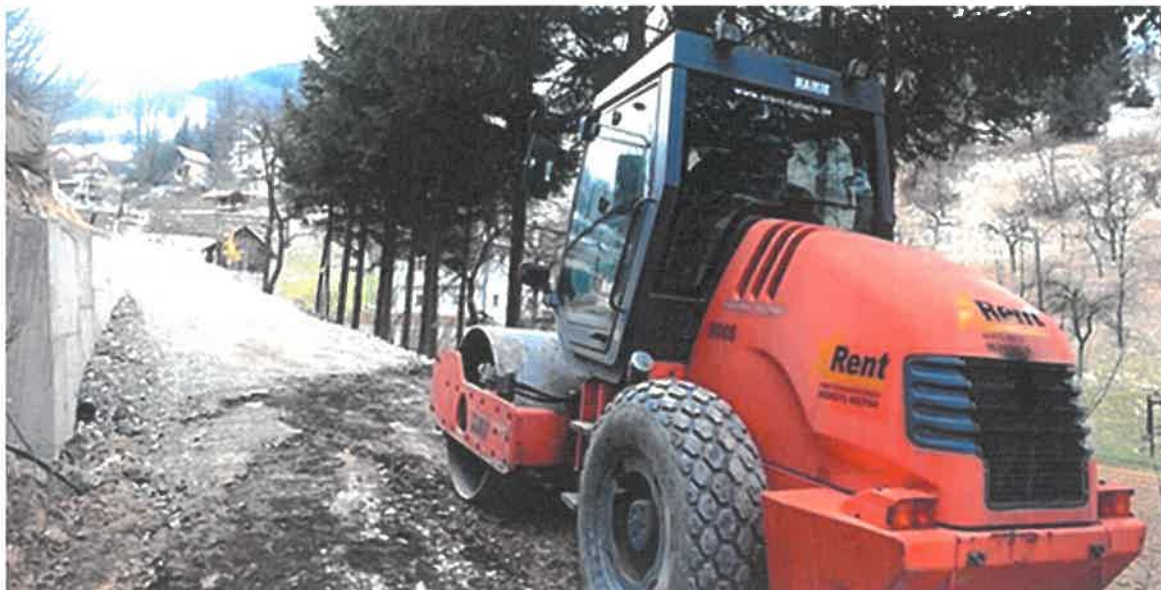
Asfaltiranje betonskog puta za Gornje Vukotiče, MZ Vukotići

U naselju Vukotići izvršeno je asfaltiranje dijela betonskog puta u dužini od 180 metara. Vrijednost izvedenih radova je 21.591,18 KM, a izvođač je PD „Ado-Trans“ d.o.o. Visoko.