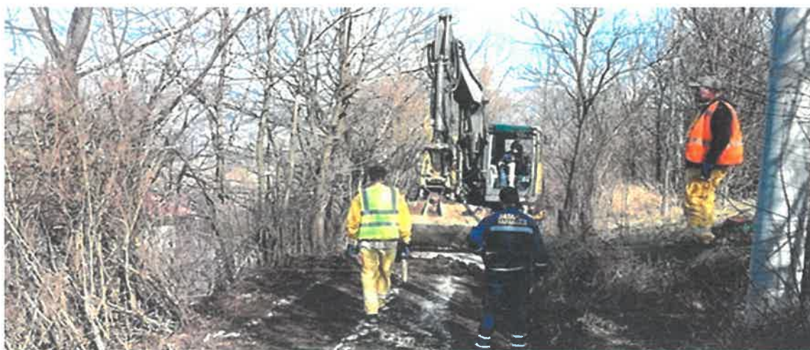
Sanacija i asfaltiranje puta za Gornje Krivače

Ugovor o izvođenju radova na sanaciji i asfaltiranju puta za Gornje Krivače zaključen je krajem 2019. godine, te zbog nepovoljnih vremenskih uslova isti nije mogao biti realizovan u toj godini. Tek po poboljšanju vremenskih uslova u 2020. godini, u Mjesnoj zajednici Brist okončani su radovi asfaltiranja puta za Gornje Krivače od broja 60 do broja 84, ukupne dužine 1100 metara. Radove čija je vrijednost 93.477,00 KM je izvelo preduzeće "JATA GROUP" d.o.o. Srebrenik.