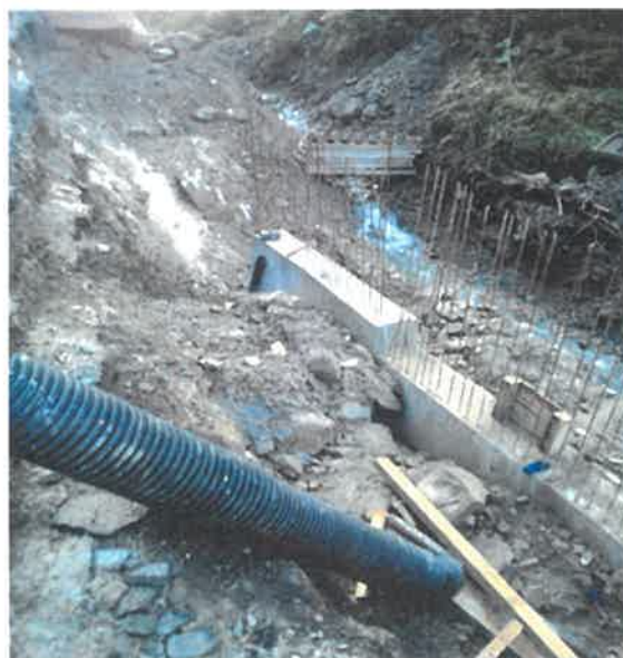
Izgradnja potpornih zidova uz cestu Donja Gračanica-Jezero, MZ Donja Gračanic