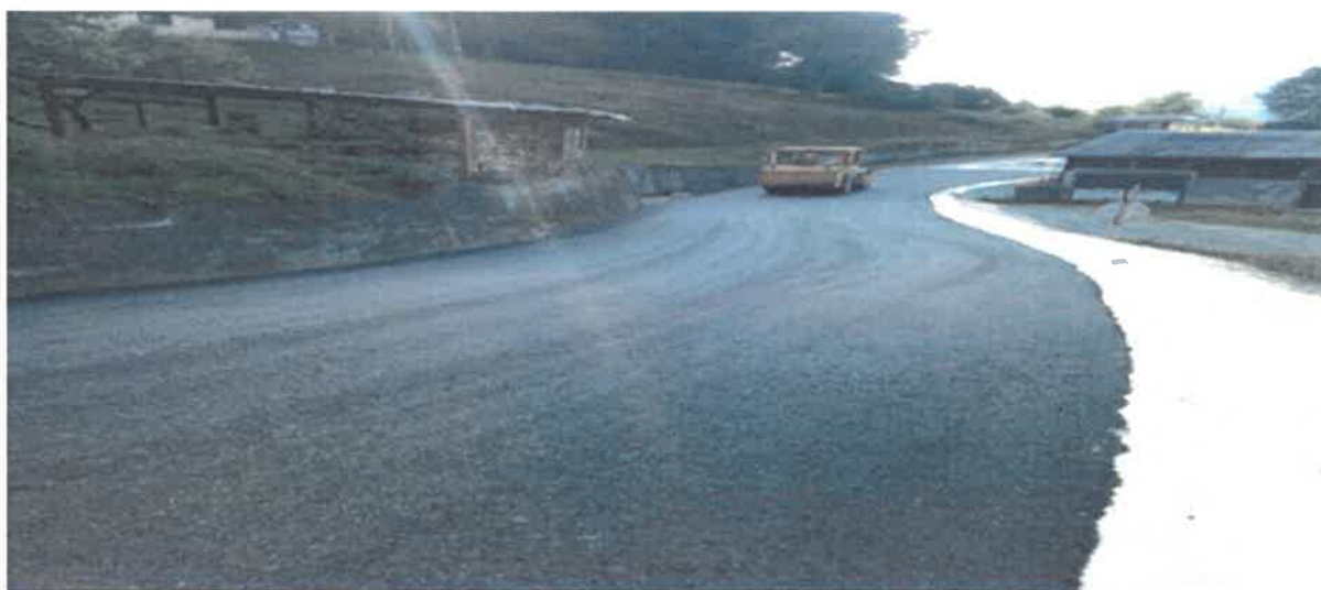
Asfaltiranje puta od Društvenog doma prema Gorici, MZ Putovići

Izradom gornjeg stroja kolovoza u naselju Putovićima okončani su radovi na sanaciji puta od Društvenog doma prema MZ Gorica. Dužina sanirane dionice je 250 m. Vrijednost radova iznosi 28.466,10 KM i izvođač istih je PD „Ado-Trans“ d.o.o. Visoko.