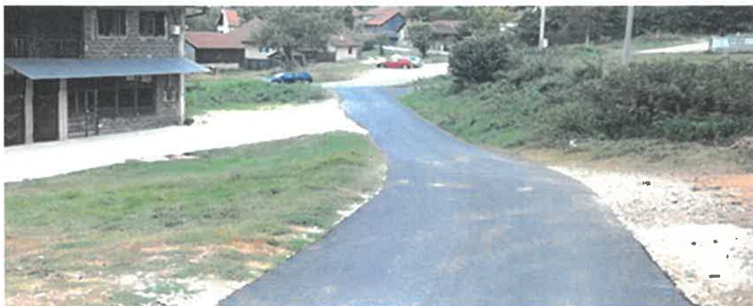
Asfaltiranje puta za selo Vjetrenice, MZ Čajdraš

U 2020. godini završeni su radovi na asfaltiranju dijela betonskog puta u naselju Vjetrenice, u dužini od 300 metara, u MZ Čajdraš. Radove je izveo konzorcij "Komgrad-Ze" d.o.o. Zenica i "ALMY TRANSPORT" d.o.o. Zenica i vrijednost istih iznosi 21.914,71 KM.