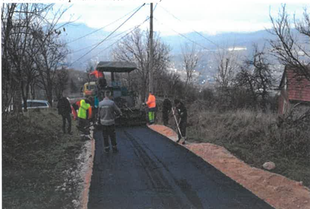
Sanacija puta od Gradskog groblja kroz naselje Prašnice, MZ Raspotočje

Završeni su radovi na asfaltiranju puta od Gradskoj groblja kroz naselje Prašnice, u dužini od 330 metara. Izvođač radova u vrijednosti od 44.621,78 KM bilo je PD "Komgrad-Ze" d.o.o. Zenica. Na ime prekoračenja rokova u izvođenju radova primijenjena je ugovorna kazna, odnosno obračunati su penali u iznosu od 1.220,42 KM.