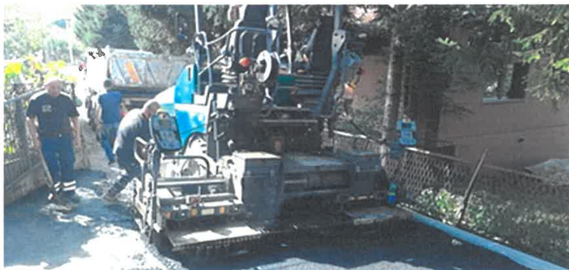
Asfaltiranje puta za Vardište od broja 95 do 103, MZ Broda

Završeni se radovi na sanaciji i asfaltiranju kraka ulice u naselju Vardište od br. 95 do 103 u dužini 135 metara. Vrijednost radova iznosi 19.760,66 KM, a iste je izvelo PD "Ado-Trans" d.o.o. Visoko.