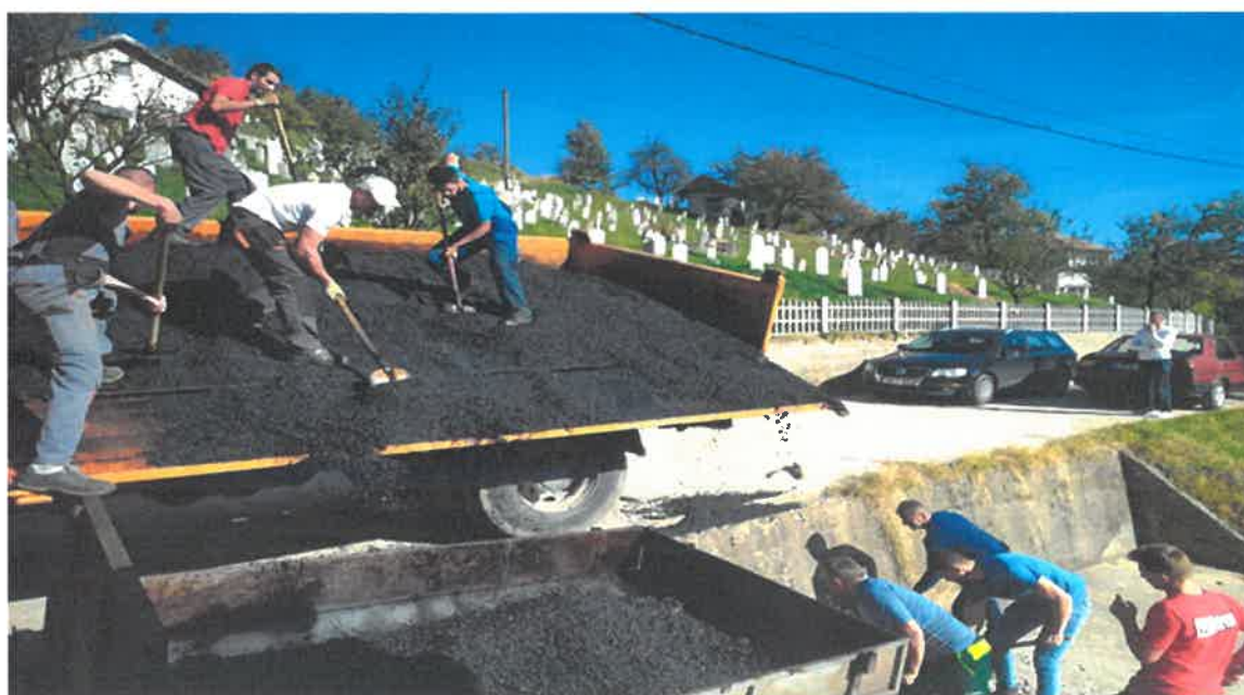
Asfaltiranje puta prema Kahrmanima, MZ Starina

U Mjesnoj zajednici Starina asfaltiran je i betonski put za zaseok Kahrmani u dužini 130 metara. Radove čija je vrijednost 23.583,65 KM je izveo konzorcij "Komgrad-Ze" d.o.o. Zenica i "ALMY TRANSPORT" d.o.o. Zenica.