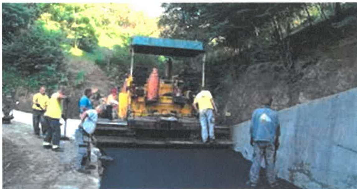
Asfaltiranje starog puta za Bisticu, MZ Bistrica

U Mjesnoj zajednici Bistrica okončani su radovi asfaltiranja starog puta dužine 400 metara. Radove u vrijednosti od 31.005,00 KM izvelo je PD "Komgrad-Ze" d.o.o. Zenica.