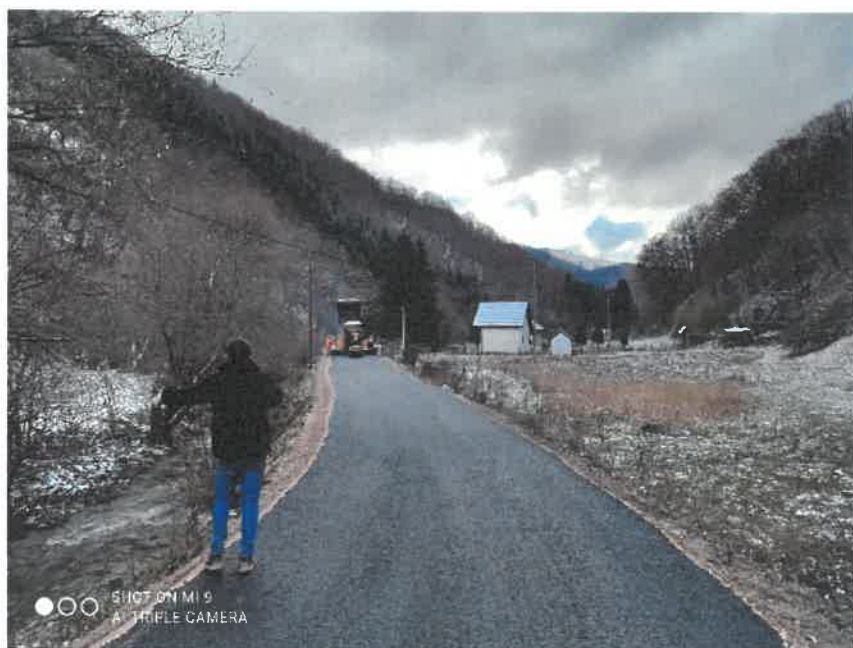
Sanacija i asfaltiranje puta Nijagara-Sebuje, MZ Sebuje

Izvrešno je asfaltiranje makadamskog puta kojim se odvija autobuski saobraćaj, u dužini od 500 metara, čime je u potpunosti sanirana ova dionica puta. Radove vrijedne 99.083,52 KM je izvelo preduzeće “ŠPIC BETON” d.o.o. Zenica.