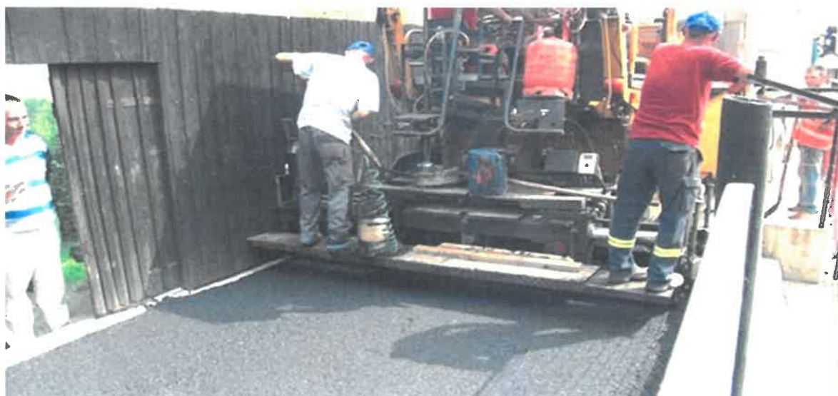
Asfaltiranje betonskog puta u naselju Jastrebac, MZ Jastrebac

U selu Jastrebac saniran je i asfaltiran betonski put u dužini od 200 metara. Radove sanacije i asfaltiranja je izvelo PD "KOMGRAD-ZE" d.o.o. Zenica, a ulaganje je vrijedno 27.478,74 KM.