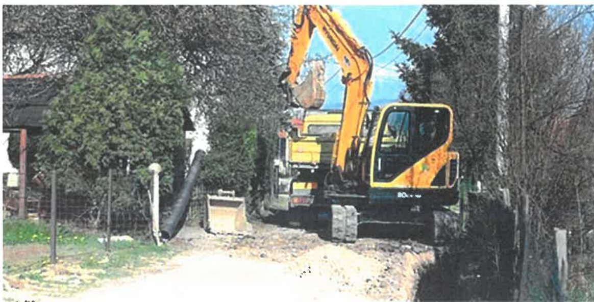
Asfaltiranje puta do džamije u Topčić Polju, MZ Topčić Polje

U Mjesnoj zajednici Topčić Polje okončani su radovi asfaltiranja puta do džamije ukupne dužine 250 metara. Radove čija je vrijednost 26.943,39 KM je izveo konzorcij "Komgrad-Ze" d.o.o. i "ALMY TRANSPORT" d.o.o. Zenica.