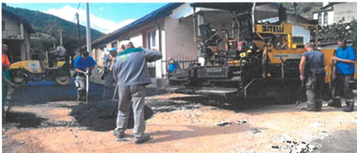
Asfaltiranje puta u naselju Donja Vraca, MZ Donja Vraca

U naselju Donja Vraca izvršeno je asfaltiranje 4 kraka puta, ukupne dužine 385 metara, u vrijednosti od 34.009,15 KM. Radove je izvelo preduzeće "Ado-Trans" d.o.o. Visoko. Osim asfaltiranja puta u MZ Donja Vraca riješen je i problem odvodnje oborinskih voda.