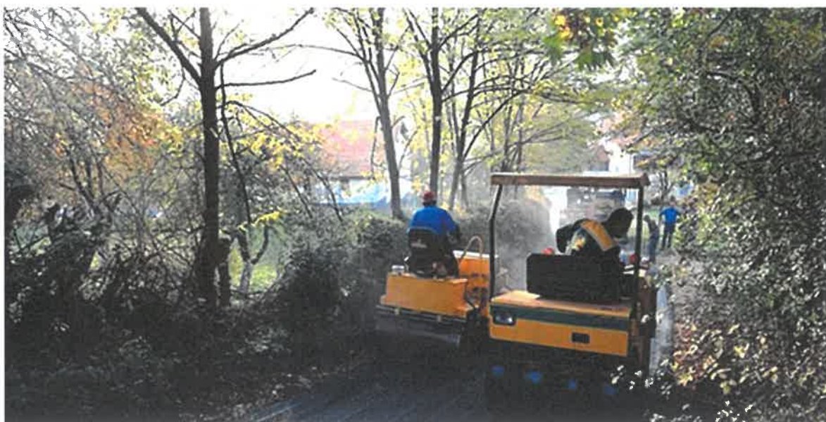
Sanacija asfaltne podloge -Ibrakovića put, MZ Klopče

U Mjesnoj zajednici Klopče završena je sanacija dijela ulice Ibrakovića put. Dužina sanirane dionice je 495 metara. Vrijednost izvedenih radova je 54.371,12 KM. Radove je izvodilo PD "MUŠINBEGOVIĆ GRADNJA" d.o.o. Visoko.