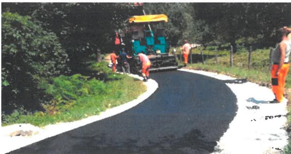
Asfaltiranje puta u naselju Tišina, MZ Tišina

U Mjesnoj zajednici Tišina okončani su radovi asfaltiranja puta dužine 740 metara. Radove čija je vrijednost 83.139,66 KM je izveo konzorcij "Komgrad-Ze d.o.o. Zenica i "ALMY TRANSPORT" d.o.o. Zenica.