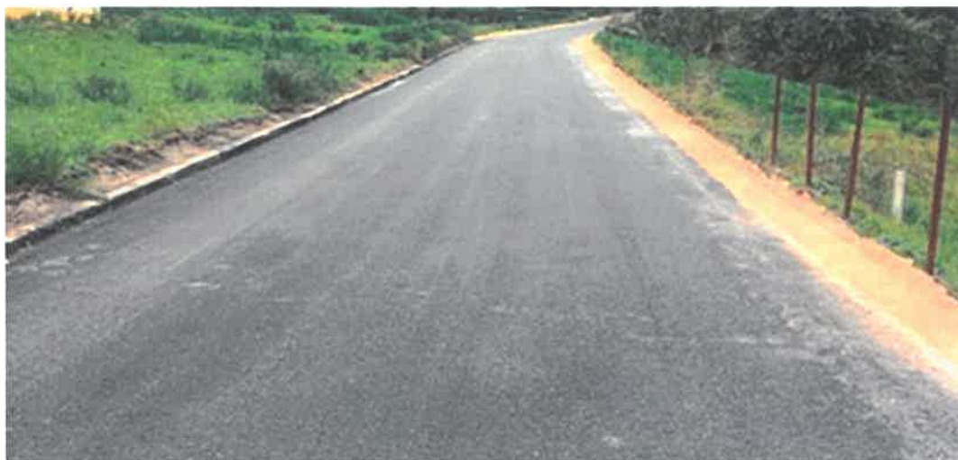
Rekonstrukcije i asfaltiranje puta Urije-autobuska okretnica, MZ Gornja Zenica

U Mjesnoj zajednici Gornja Zenica okončani su radovi na rekonstrukciji i asfaltiranju puta Urije - autobuska okretnica. Izvršena je sanacija i asfaltiranje dionice puta u dužini 750 metara. Osim ove dionice, asfaltiran je i put od autobuske okretnice prema selu Gumanci u dužini od 150 metara. Vrijednost izvedenih radova je 104.087,32 KM sa PDV-om, a izvođač je PD "KOMGRAD-ZE" d.o.o. Zenica.