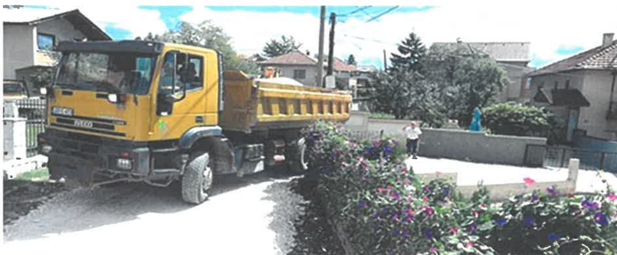
Asfaltiranje odvojka ul. Hadžije Mazića od broja 22 do 52-Put za Ziliće, MZ Klopče

Izvršeno je asfaltiranje dotrajalog makadamskog puta za Ziliće u dužini 420 m, uz prethodno rješavanje odvodnje. Vrijednost ugovorenih radova tokom kojih je uz asfaltiranje urađena i odvodnja, iznosi 52.929,28 KM. Radove je izvodio konzorcij "Komgrad-Ze" i "ALMY TRANSPORT" d.o.o. Zenica.