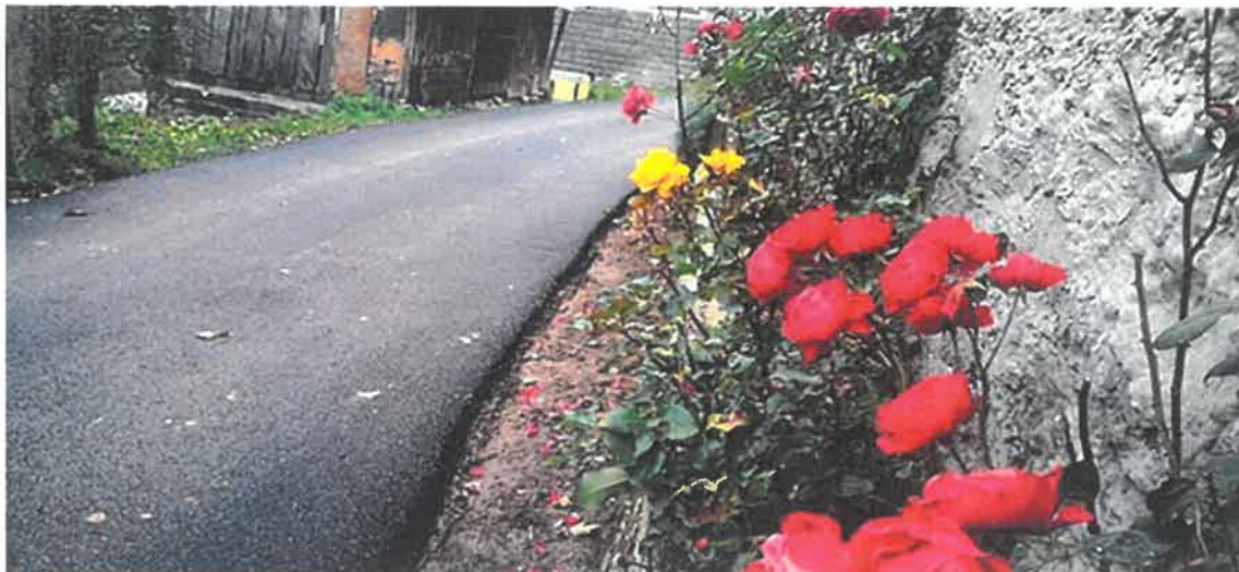
Sanacija i asfaltiranje puta kroz selo Višnjica, MZ Lašva

U Mjesnoj zajednici Lašva završeni su radovi asfaltiranja degradiranih betonskih puteva, odnosno dva kraka od 575,0 i od 590 metara, kroz selo Gornja Višnjica. Vrijednost izvedenih radova je 117.644,61 KM, i iste je izvodilo PD "Komgrad – Ze" d.o.o. Zenica.