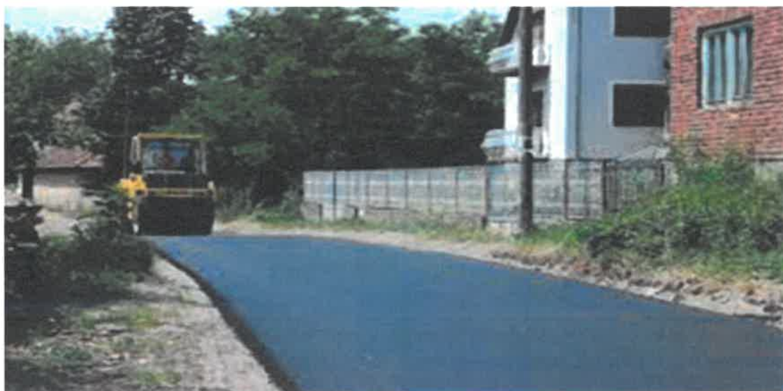
Asfaltiranje dijela ulice Doglodska, MZ Nemila

U Mjesnoj zajednici Nemila okončani su radovi asfaltiranja dijela ulice Doglodska u dužini od 395 metara. Radove čija je vrijednost 44.230,96 KM je izvelo PD "KOMGRAD-ZE" d.o.o. Zenica.