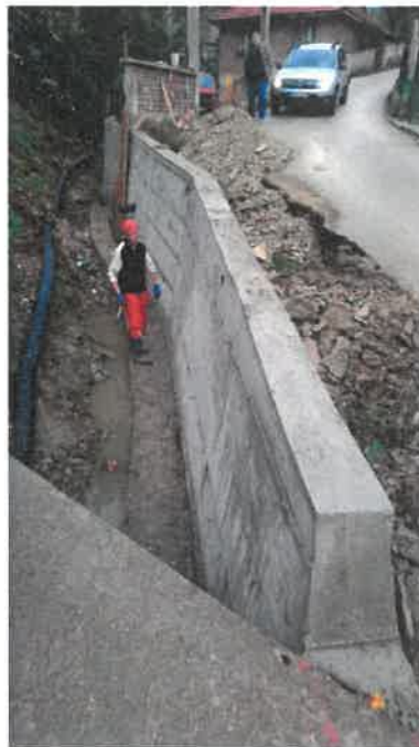
Izgradnja potpornog zida uz potok Bukovica, MZ Banlozi