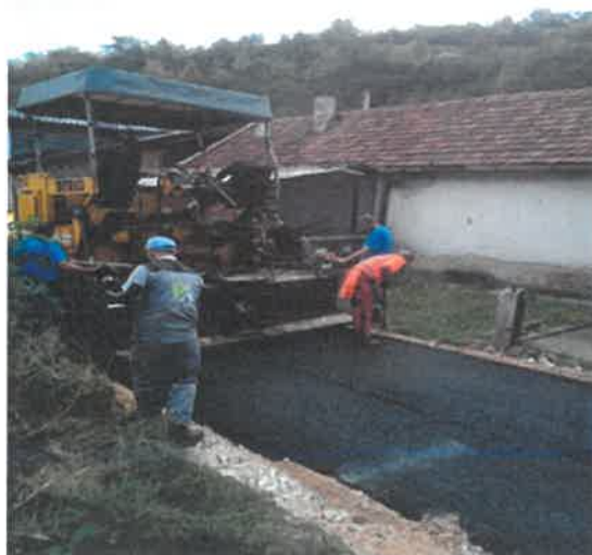
Asfaltiranje puta Barake-džamija, MZ Broda