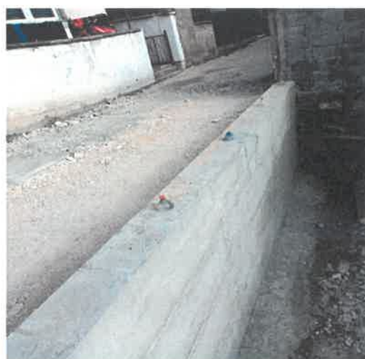
Asfaltiranje betonskog puta za Tulek, MZ Ričice