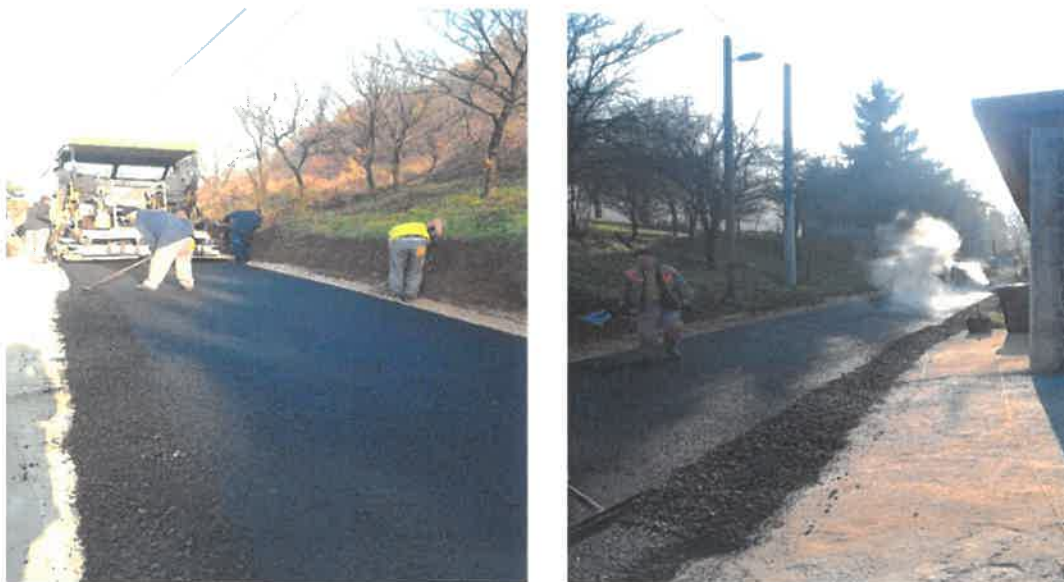
Sanacija i asfaltiranje puta za Kondžila, MZ Podbrežje

U Mjesnoj zajednici Podbrežje okončani su radovi sanacije i asfaltiranja puta za Kondžilo dužine 340 metara. Radove čija je vrijednost 36.849,21 KM je izvelo PD "GEO-PUT" d.o.o. Maglaj. Sanaciji i asfaltiranju ove ulice u MZ Podbrežje prethodilo je izvođenje radova na vodovodnoj mreži od strane Javnog preduzeća „Vodovod i kanalizacija“ d.o.o. Zenica.