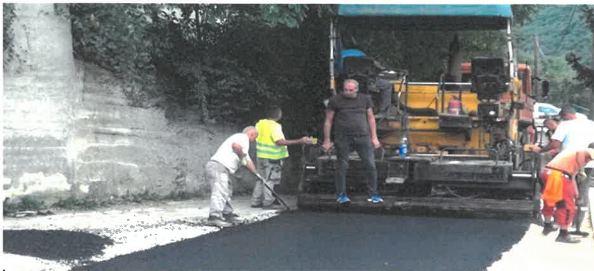
Sanacija i asfaltiranje puta Velika Broda-Grm, MZ Broda

Okončani su radovi na sanaciji i asfaltiranju puta Velika Broda - Grm. Riječ je o dionici dotrajalog puta dugoj 500 metara. Ulaganje je vrijedno 65.252,13 KM, radove je izveo konzorcij PD „Komgrad - Ze“ d.o.o. Zenica – „ALMY TRANSPORT“ d.o.o. Zenica.