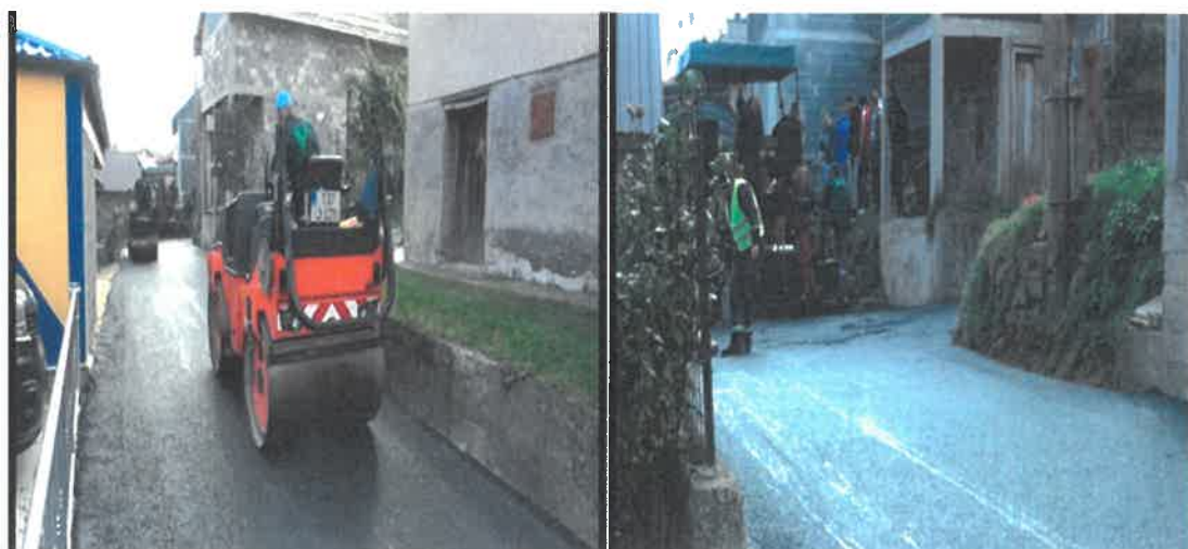
Asfaltiranje puta kroz selo Šerići, MZ Šerići

U Mjesnoj zajednici Šerići okončani su radovi asfaltiranja betonskog kraka kroz selo Šerići dužine 600 metara. Radove čija je vrijednost 58.157,98 KM je izvelo PD "Komgrad – Ze" d.o.o. Zenica.