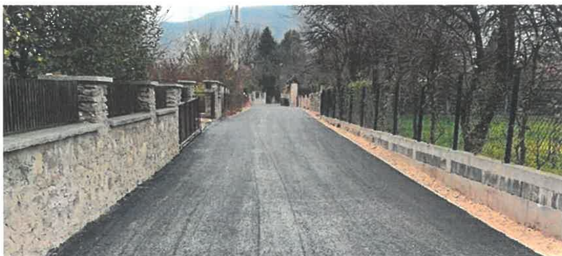
Asfaltiranje makadamskog puta za Mrtvice, MZ Lukovo Polje

Vrijednost izvedenih radova je 42.316,15 KM, a izvođač istih je PD "GEO-PUT" d.o.o. Maglaj.