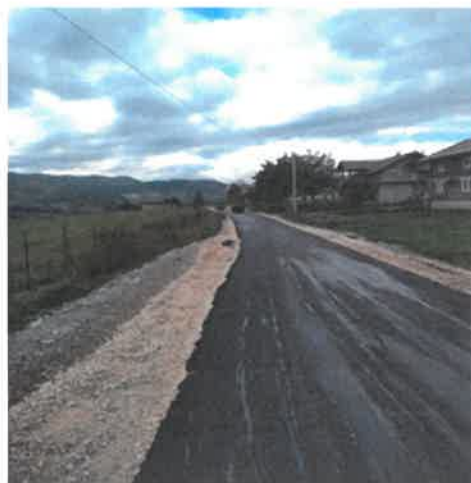
Sanacija puta prema naselju Strnokosi