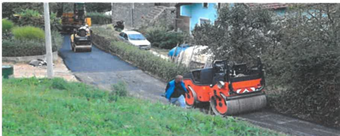
Asfaltiranje puta kroz od škole do Gornjih Kovanića, MZ Kovanići

Mještanima je sada na raspolaganju 810 metara saniranog i asfaltiranog puta. Početak dionice je odvojak sa lokalne ceste M17 - Kovanići - Begov Han, a kraj dionice je kod šehidske česme u Gornjim Kovanićima. Radove u vrijednosti 68.062,23 KM izvelo je PD "Komgrad-Ze" d.o.o. Zenica.