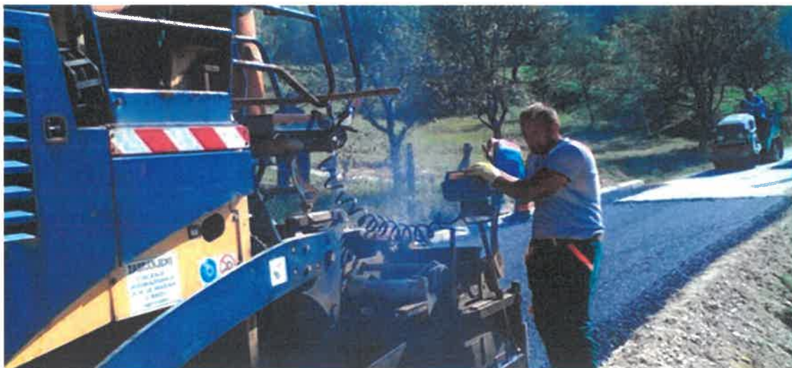
Asfaltiranje puta za Crnile, MZ Trgovišće

Zbog velikih oštećenja i dotrajalosti sanirana je ulica u naselju Crnileu Mjesnoj zajednici Trgovišće, u dužini od 290 metara. S obzirom da se radi o ulici koja se proteže kroz gusto naseljeno mjesto asfaltiranje je izvršeno u punom gabaritu ulice. PD "MUŠINBEGOVIĆ GRADNJA" d.o.o. Visoko, izvelo je radove na sanaciji ulice Crnile, a njihova ukupna vrijednost je 35.217,00 KM.