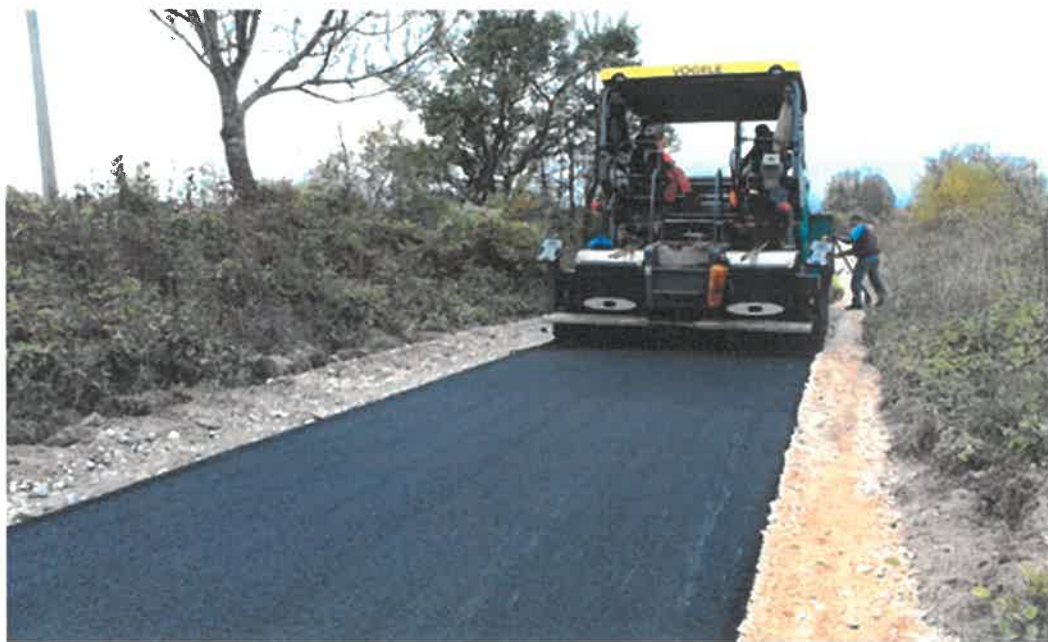
Asfaltiranje betonskog puta za Spahiće, MZ Orahovica

U Mjesnoj zajednici Orahovica okončani su radovi asfaltiranja betonskog puta za Spahiće dužine 160 metara. Radove čija je vrijednost 17.976,03 KM je izveo konzorcij "Komgrad-Ze" d.o.o. i "ALMY TRANSPORT" d.o.o. Zenica.