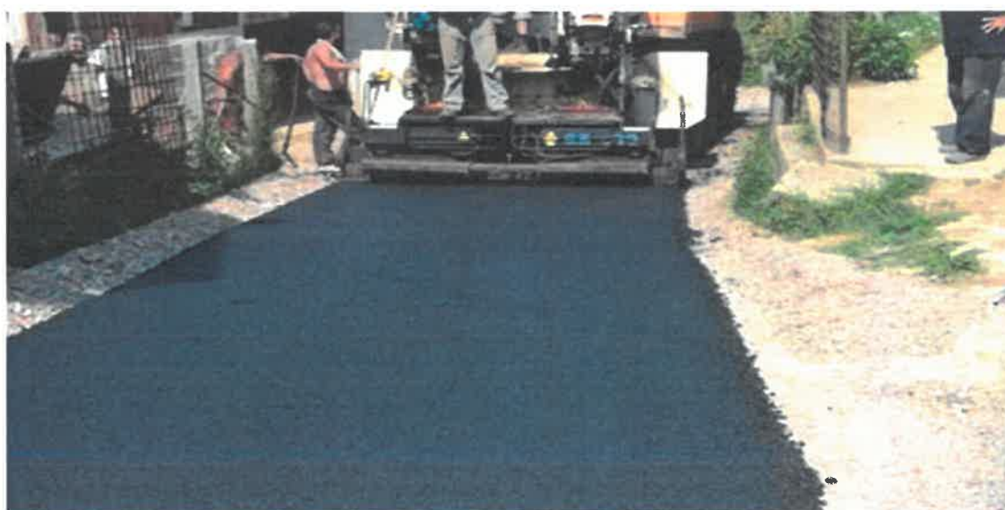
Sanacija dijela ulice Zvečajska, MZ Raspotočje

U Mjesnoj zajednici Raspotočje izvršena je sanacija i asfaltiranje dijela ulice Zvečajske dužini od 200,00 m. Vrijednost izvedenih radova je 30.272,66 KM, a iste je izvodilo PD "Komgrad-Ze" d.o.o. Zenica.