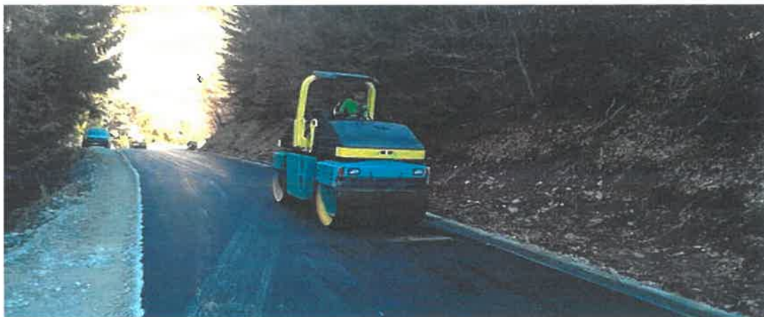
Asfaltiranje dionice puta Seoci - Osredak – Gradina

U decembru 2019. godine je zaključen Ugovor o asfaltiranju dionice puta Seoci - Osredak – Gradina. Vremenski uslovi nisu dozvoljavali izvođenje ugovorenih radova, te je iz tog razloga realizacija ugovorenih radova prolongirana za 2020. godinu, kada su završeni radovi na asfaltiranju dionice puta Seoci-Osredak-Gradina, u dužini od 420 metara. Radovi u vrijednosti od 79.827,45 KM izvedeni su od strane PD "Komgrad-Ze" d.o.o. Zenica.