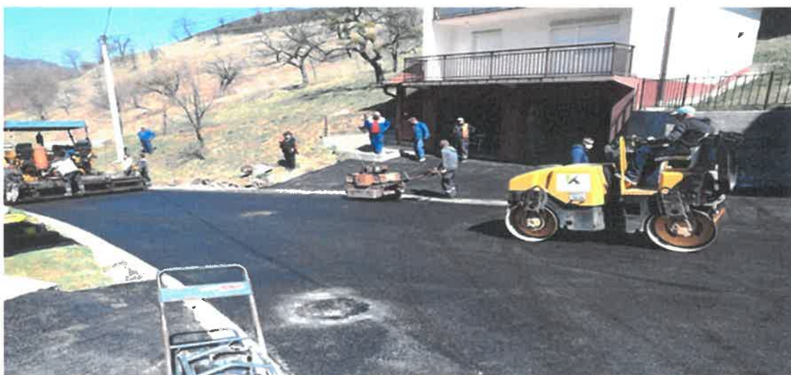
Rekonstrukcija puta Donje Vražale-Gornje Vražale

Po poboljšanju vremenskih uslova u februaru 2020. godine započelo je izvođenje radova na rekonstrukciji puta Donje Vražale-Gornje Vražale, a u aprilu 2020. godine asfaltirana je dionica puta u dužini od 284 metra. Radove čija je vrijednost 104.795,95 KM je izvelo PD „Komgrad-Ze“ d.o.o. Zenica.