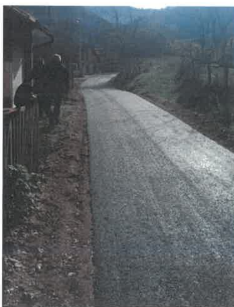
Asfaltiranje puta za naselje Šarići, MZ Donja Gračanica

U Mjesnoj zajednici Donja Gračanica okončani su radovi asfaltiranja betonskog puta dužine 130 metara za naselje Šarići. Radove čija je vrijednost 13.459,23 KM je izvelo PD "KOMGRAD-ZE" d.o.o. Zenica.