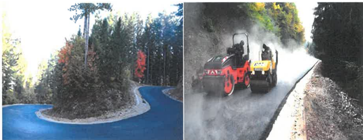
Završetak fazne rekonstrukcije puta Seoci-Osredak-Gradina, MZ Osredak-Gradina

Vrijednost izvedenih radova je 226.112,27 KM. Radove je izveo konzorcij "Komgrad-Ze" d.o.o. Zenica i "ALMY TRANSPORT" d.o.o. Zenica.