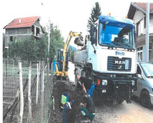
Izgradnja pješačke staze od prvog propusta lokalne ceste Perin Han do skretanja za selo Palinoviće