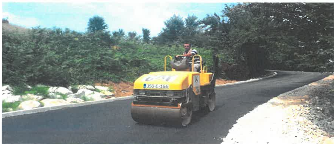
Završetak izgradnje puta za naselje Dobriljeno, MZ Dobriljeno

U Mjesnoj zajednici Dobriljeno okončani su radovi sanacije puta dužine 200 metara sa prethodno riješenom odvodnjom. Radove čija je vrijednost 33.382,94 KM je izveo konzorcij PD "Komgrad-Ze" d.o.o. Zenica i "ALMY-TRANSPORT" d.o.o. Zenica.