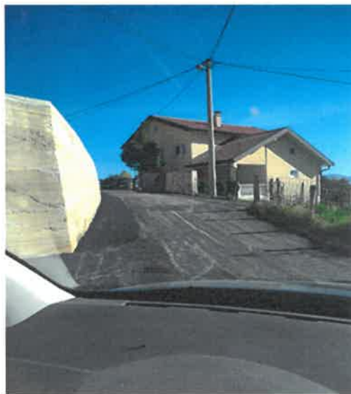
Asfaltiranje puta prema Brižđu, MZ Starina