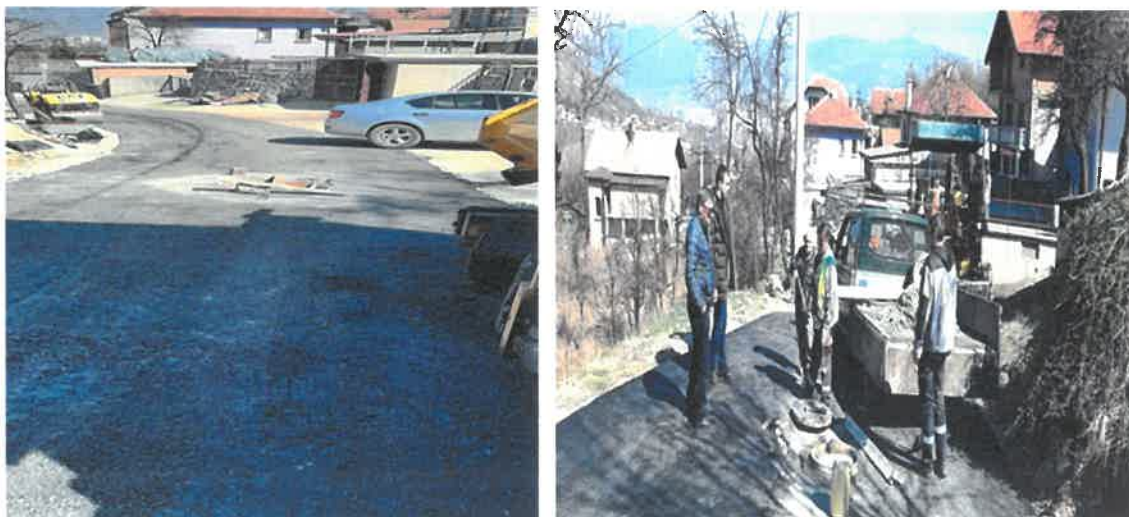
Sanacija i asfaltiranje saobraćajnice Podurije, MZ Trgovišće

Obzirom da je Ugovor o sanaciji i asfaltiranju puta za Podurije zaključen u decembru 2019. godine, kada vremenski uslovi nisu dozvoljavali izvođenje ugovorenih radova, realizacija istog je prolongirana za 2020. godinu. U Mjesnoj zajednici Trgovišće u 2020. godini okončani su radovi sanacije i asfaltiranja puta za Podurije ukupne dužine 300 metara. Radove čija je vrijednost 42.793,99 KM je izvelo PD "Komgrad – Ze" d.o.o. Zenica.