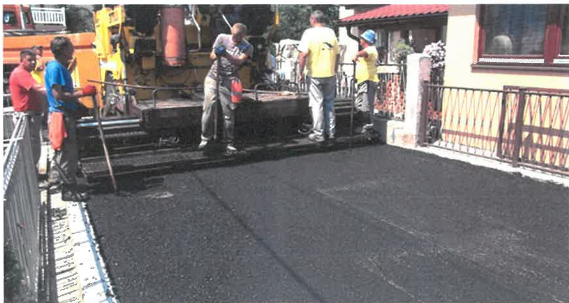
Asfaltiranje puta prema pekari Mido, MZ Pehare

Izvršena je sanacija i asfaltiranje 4 servisne saobraćajnice u Mjesnoj zajednici Pehare, dužine 330 metara a nakon rješavanja problema vodosnadbijevanja i odvodnje. Radove u vrijednosti od 48.309,30 KM izvelo je PD "Komgrad-Ze" d.o.o. Zenica.