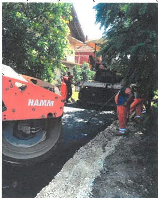
Sanacija postojećeg puta za selo Konjevići, MZ Pojske

U Mjesnoj zajednici Pojske okončani su radovi sanacije i asfaltiranja puta dužine 1200 metara. Radove čija je vrijednost 76.798,59 KM je izvelo preduzeće “Komgrad-Ze” d.o.o. Zenica.