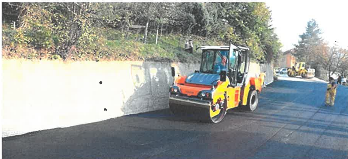
Sanacija i asfaltiranje ulice Bistua Nuova, MZ Novo Radakovo

Početkom septembra 2020. Godine asfaltirana je dionica ulice Bistua Nuova u dužini od jednog kilometra. Radovi su se izvodili nakon izgradnje glavnog magistralnog cjevovoda Putovići (Plava voda ). Vrijednost izvedenih radova iznosi 182.364,09 KM i izvelo ih je PD "Komgrad – Ze" d.o.o. Zenica.