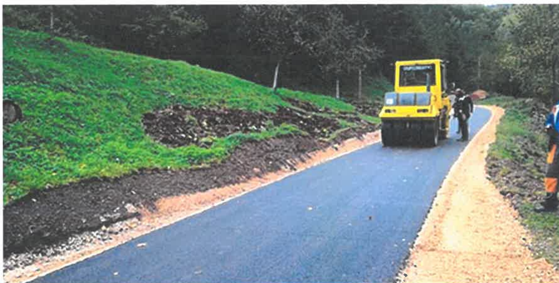
Nastavak sanacije i asfaltiranja puta za naselje Žičara

U naselju Žičara izvedeni su radovi na asfaltiranju makadamskog puta u dužini od 400 . Izvođenjem ovih radova spojeno je naselje Žičara sa lokalnom cestom za Bistričak. Vrijednost radova iznosi 42.788,01 KM i iste je izvelo PD "Geo – Put" d.o.o. Maglaj.