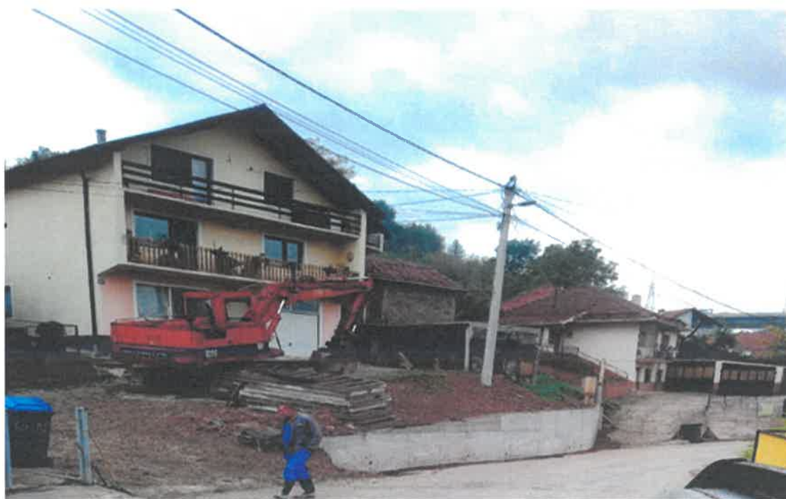
Izgradnja potpornog zida uz saobraćajnicu u ulici Ahmeta Hafizovića kod broja 64, MZ Donja Gračanica

U Mjesnoj zajednici Donja Gračanica okončani su radovi na izgradnji potpornog zida uz saobraćajnicu u ulici Ahmeta Hafizovića kod broja 64. Radove čija je vrijednost 15.821,61 KM je izvelo PD "TKM" d.o.o. Zenica.