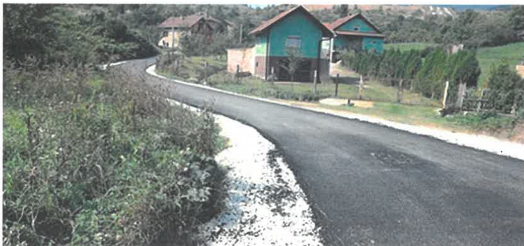
Asfaltiranje makadamskog puta u ulici Envera Čerkeza, MZ Tetovo

U Mjesnoj zajednici Tetovo završena je sanacija i asfaltiranje dijela makadamskog puta u dužini 150 metara sa proširenja na spoju sa glavnom cestom. Radove vrijedne 14.198,41 KM izvelo je PD "Ado-Trans" d.o.o. Visoko.