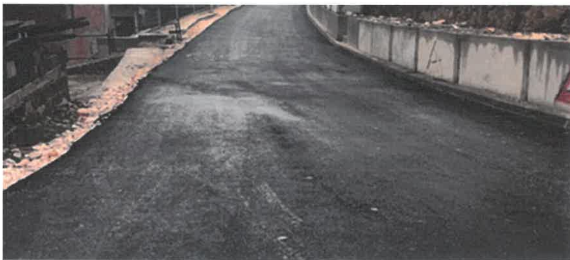
Nastavak rekonstrukcije puta za Vražale u dužini, MZ Vražale

U Mjesnoj zajednici Vražale rekonstruisana je dionica puta Donje Vražale - Gornje Vražale. Izvršena je rekonstrukcija puta u dužini 197,60 metara sa izgradnjom potpornih zidova koji su u funkciji zaštite puta. Vrijednost radova je 113.254,23 KM. Radi se o faznoj realizaciji projekta, obzirom da je u ranijem periodu već rekonstruisano 600 metara puta, a nakon ovih radova preostalo je još da se rekonstruiše 1400 metara puta. Radove je izveo konzorcij PD "Komgrad-Ze" d.o.o. Zenica i "ALMY-TRANSPORT" d.o.o. Zenica.