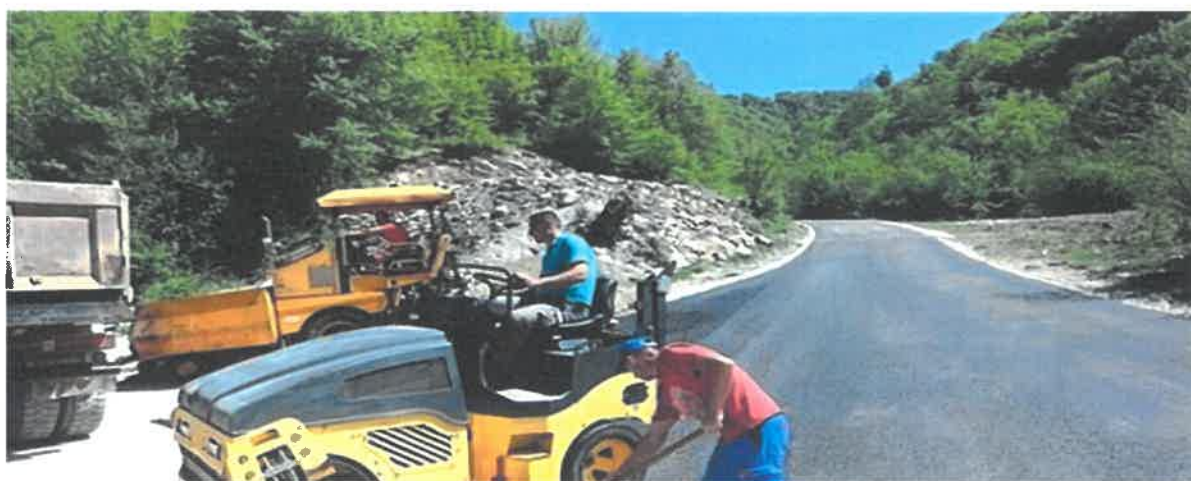
Rekonstrukcija puta za selo Biškoviće

U Mjesnoj zajednici Babino okončani su radovi rekonstrukcije i asfaltiranja puta dužine 550 metara. Radove čija je vrijednost 100.732.90 KM kao i dodatne radove u vrijednosti 9.968,40 KM je izvelo privredno društvo "ŠPIC BETON" d.o.o. Zenica. U 2020. godini je, po osnovu dva ugovora o izvođenju radova, finansijski realizovano 60.202,35 KM.