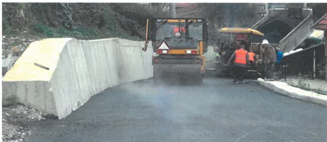
Asfaltiranje puta prema izvorištu Džomba, MZ Gradišće

Krajem oktobra 2020. godine okončani su radovi na asfaltiranju puta prema izvorištu Džomba sa sanacijom dijela postojećeg vodotoka u Mjesnoj zajednici Gradišće. Početak dionice je od raskrsnice, odvojak sa puta Gradišće - Stranjani, a kraj dionice je prema izvorištu Džomba, ukupne dužine od 100,00 m. U sklopu ovog projekta izvršena je sanacija postojećeg vodotoka ucjevljenjem dva kraka ukupne dužine 82,0 m. Vrijednost radova iznosila je 39.454,69 KM i iste je izvodilo PD "Mušibegović gradnja" d.o.o. Visoko.