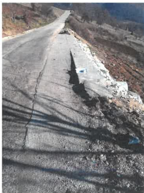
Sanacija klizišta na putu za Vrselje, MZ Vrselje