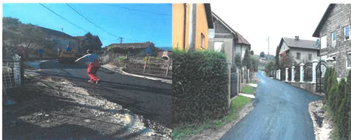
Sanacija i asfaltiranje ulice Marka Rajića, MZ Podbrežje

Radove vrijedne 39.092,04 KM izvelo je PD „MUŠINBEGOVIĆ GRADNJA“ d.o.o. Visoko. Asfaltirano je 320 metara ulice u punom profilu, kao i dodatnih 51 metar najkritičnijih oštećenja od ostataka ulice. Sanaciji i asfaltiranju ove ulice u MZ Podbrežje prethodilo je izvođenje radova na vodovodnoj mreži od strane Javnog preduzeća „Vodovod i kanalizacija“ d.o.o. Zenica.