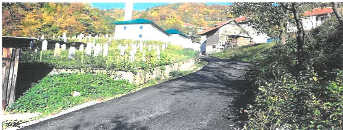
Sanacija degradiranih betonskih puteva kroz MZ Gornja Gračanica

Asfaltiranjem puta kroz naselje Čekote u Mjesnoj zajednici Gornja Gračanica završena je sanacija posljednjeg od tri ugovorena putna pravca. Radi se o sanaciji degradiranih betonskih puteva u dužini od jednog kilometra u naseljima Čekote, Drinjani i Jezero. Radove vrijedne 91.088,52 KM izvelo je PD "KOMGRAD-ZE" d.o.o. Zenica.