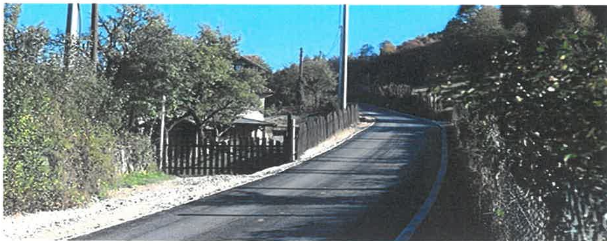
Sanacija i asfaltiranje makadamskog puta kroz selo Plahoviće, MZ Donja Gračanica

U naselju Plahovići, u Mjesnoj zajednici Donja Gračanica, završena je sanacija i asfaltiranje makadamskog puta u dužini od 615 metara, i time je u potpunosti završena sanacije putne komunikacije kroz selo Plahovići. Vrijednost izvedenih radova je 111.010,75 KM, a izvelo ih je PD "MGV GRADNJA" d.o.o. Zavidovići.