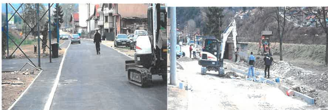
Rekonstrukcija ulice Bilmišće

Ugovor o izvođenju radova na rekonstrukciji ulice Bilmišće zaključen je krajem 2019. godine, te zbog nepovoljnih vremenskih uslova isti nije mogao biti realizovan u toj godini. Po poboljšanju vremenskih uslova u 2020. godini završena je rekonstrukcija dijela ulice Bilmišće u dužini od 392 metra. Zbog potrebe asfaltiranja kraka prema školi u Bilmišću u dužini od 51 metar izvedeni su dodatni radovi na rekonstrukciji ulice Bilmišće. Ugovori u ukupnoj vrijednosti od 312.989,51 KM zaključeni su sa PD "ADO-TRANS" d.o.o. Visoko. U 2020. godini finansijski je realizovano 230.513,14 KM.