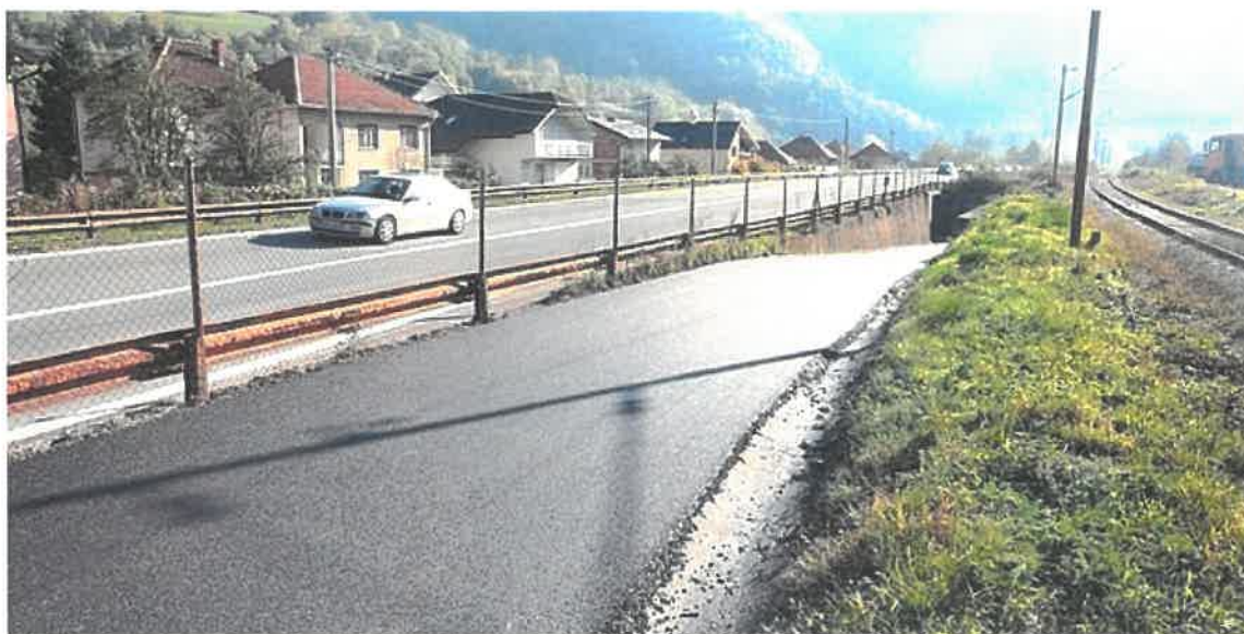
Sanacija i asfaltiranje puta uz potok Baretnjak, MZ Topčić Polje

Okončani su radovi na sanaciji i asfaltiranju makadamskog puta uz potok Baretnjak u Mjesnoj zajednici Topčić Polje. Radi se o cesti koja predstavlja jedinu putnu komunikaciju kroz selo, a koja je u potpunosti uništena u poplavama 2014. godine. Vrijednost izvedenih radova iznosi 71.178,79 KM. Radove je izvelo PD "GEO-PUT" d.o.o. Maglaj.