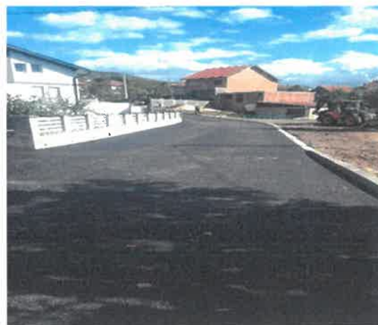
Sanacija i asfaltiranje Prvomajske ulice do spoja sa ulicom Hadžije Mazića, MZ Klopče