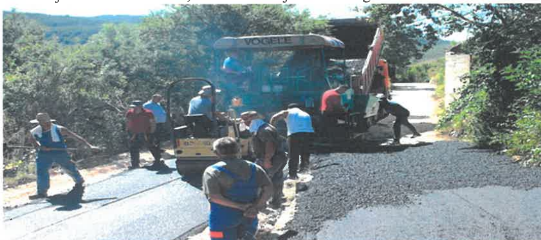
Sanacija asfaltne podloge u ulici Janjički slapovi, MZ Janjići

Završeni su radovi na asfaltiranju puta u ulici Janjički slapovi u MZ Janjići u dužini 1060 m. Radove u vrijednosti od 100.281,24 KM izvelo je PD "Komgrad-Ze" d.o.o. Zenica.